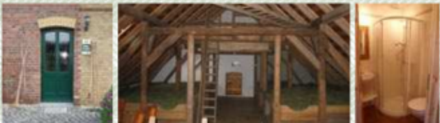
von Mai bis Oktober, im eigenen Schlafsack