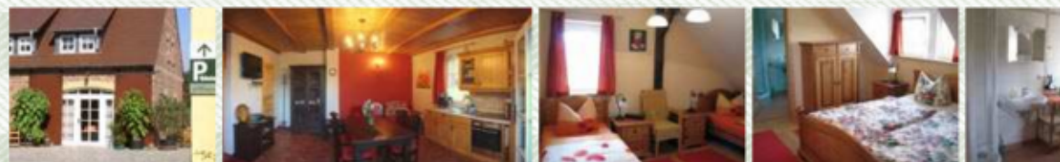
FeWo Schwalbe für 2–4 Personen · 55 m 2