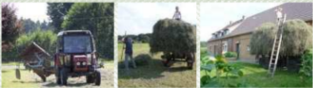
Ein bleibendes Erlebnis – Übernachten im Heu