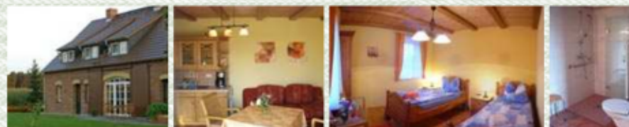
FeWo Kranich für 1–2 Personen · auch behindertengerecht · 40 m 2

Unsere Ferienwohnungen im liebevoll sanierten, denkmalgeschützten Dreiseithof