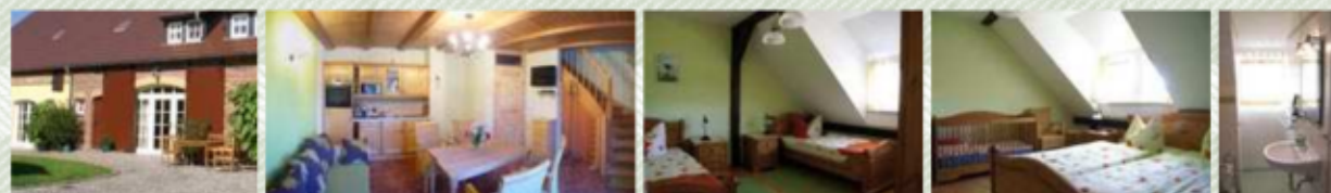
FeWo Laubfrosch für 2–4 Personen · 55 m 2